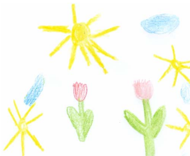
Rysunek: Kasia Narojczyk kl. 2